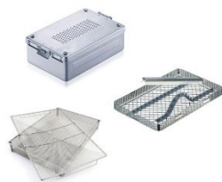
Korgar, instrumentgaller och container