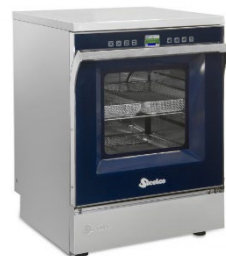
Diskdesinfektor golvmödel Olika modeller