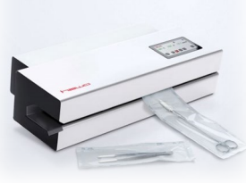
Rullsvets för packning av medicintekniska produkter