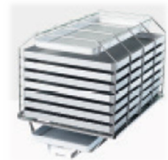
Utdragbar insats med korg för upp till 16 brickor

Tillval som kan hjälpa dig i sterilprocessen