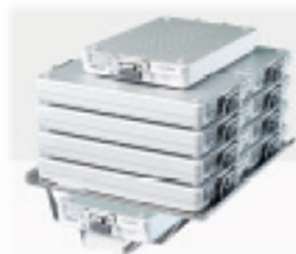
Utdragbar insats för upp till 10 container MELAstora